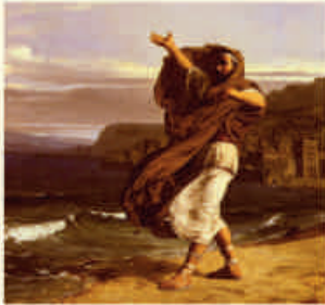
Jean Jules Antoine Lecomte du Nouÿ: Demosthenes übt sich in der Rede (1870)