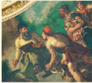
Eugène Delacroix: Aristoteles beschreibt die ihm von Alexander gesandten Tiere (1844)