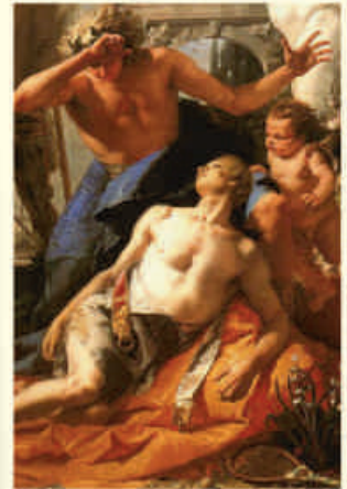
Giovanni Battista Tiepolo: Der Tod des Hyacinthus (1753)